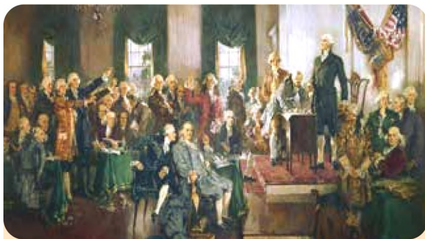
AQSH konstitutsiyasining qabul qilinishi

Konstitutsiya davlatlar vujudga kelgan davrlardan ancha kech paydo bo'ldi. Demak, davlatlar tarixan konstitutsiyasiz faoliyat yuritgan. Konstitutsiyalarning paydo bo'lishiga bir qancha omillar o'z ta'sirini o'tkazgan. Insonlarning huquq va erkinliklarini qonunlarda mustahkamlash hamda davlat va inson o'rtasidagi munosabatlarni huquqiy tartibga solish ularni alohida qonunlar orqali belgilash zaruratini vujudga keltirdi.