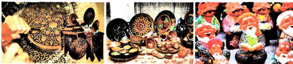
Рис. 1. Образцы продукции народных мастеров

Ниже представлены образцы изготовленной народными мастерами продукции (рис. 1).