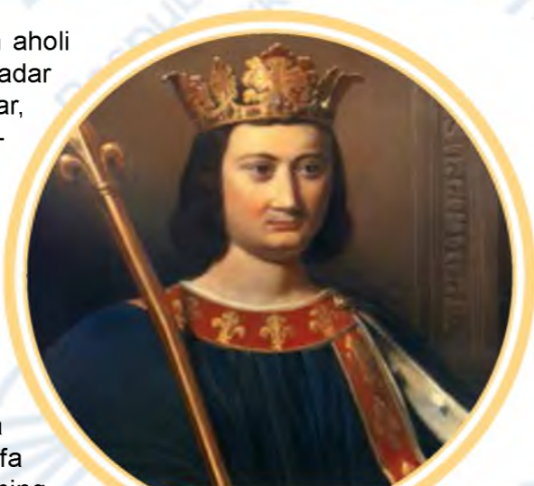
Qirol Filipp IV

Mamlakatni birlashtirish davomida butun aholi qirol fuqarolariga aylandi. Bu davrga qadar fuqarolarning aksariyat qismi yirik amaldorlar, gersog va graflar, shuningdek, boshqa zodagonlarga qaram bo'lgan. Shu davrda butun Fransiya aholisi huquq va majburiyatlari otadan bolaga meros bo'lib o'tadigan uch toifaga bo'lindi. Bulardan birinchi toifa – ruhoniylar, ikkinchi toifa – mulkdor zodagonlar bo'lib, ularning o'ziga xos imtiyozlari va huquqlari bor edi. Xususan, ular qirolga soliq to'lashdan ozod etilgandi. Uchinchi toifa boy shaharliklar, dehqonlar, hunarmandlar va shahar kambag'allarini tashkil etar edi. Bu toifa orasida boy shaharliklar yetakchilik qilib, ularning vakillari ko'pincha qirol majlislariga chaqirib turilgan.