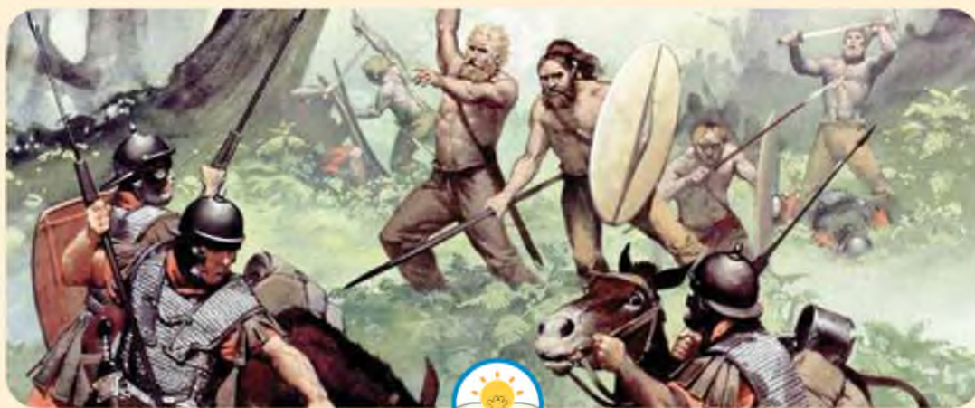
German qabilalari jang maydonida