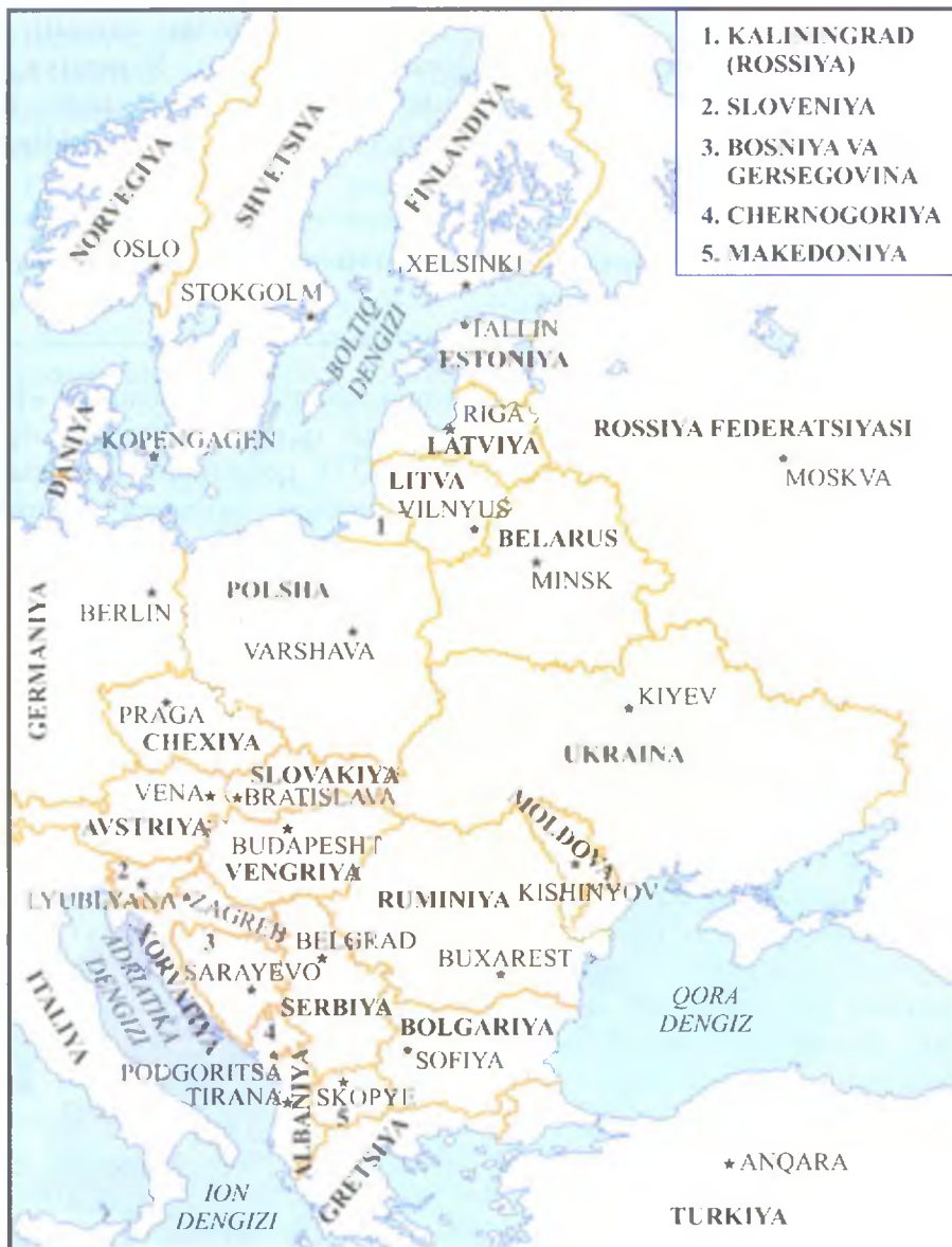
Markaziy va Sharqiy Yevropa davlatlari

dan biri Lex Valensa prezidentlik saylovlarida magʻlubiyatga uchradi. Kuchli mafkuraviy bosimga qaramasdan, soʻllar Litvada, keyinchalik Albaniyada hokimiyatga keldi.