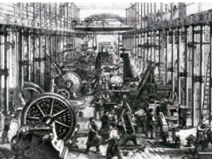
Korxonadagi ish jarayoni

rishga intilib yashadilar. Natijada dinning inson ongiga ta'siri susaydi, ko'plab mamlakatlarda dunyoviy ta'lim yo'lga qo'yilib, diniy muassasalar davlatdan, ta'lim jarayoni dindan ajratildi. Dunyoviy davlat, maktab, fan va madaniyat shakllandi. Dunyoviy yondashuv, sekulyarlik , vijdon erkinligi inson dunyoqarashining, ozod shaxs sifatida o'zini anglashining asosini tashkil qildi.