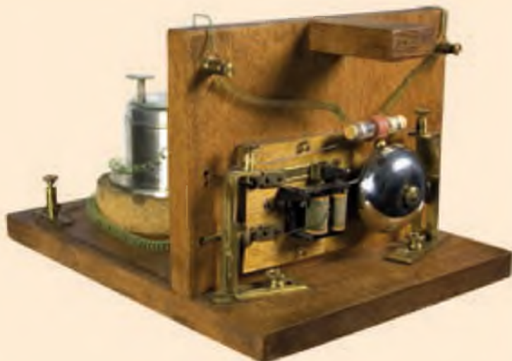
Birinchi telefon apparati

davri bo'ldi. Taraqqiyotning yangi bosqichi sanoatni tashkil qilishning yangi shakllarini talab qildi. Bu yirik ishlab chiqarishning keskin rivojlangan davri ulkan moliyaviy sarf-xarajatlarni talab qilardi. Bunday katta mablag'larni bir joyga to'plash uchun aksionerlik kompaniyalari tashkil qilindi. Bu kompaniyalar yirik banklar va sanoatchilarga o'z mablag'larini bir joyga jamlash imkonini berdi. Ammo shu tariqa paydo bo'lgan moliya oligarxiyasi tezda jamiyatning tor elita qatlamiga aylanib, industrial sivilizatsiya qaror topgan ilg'or mamlakatlarda XX asr boshiga kelib iqtisodiy va siyosiy yetakchilikni qo'lga oldi. Bunday jarayonlar keyinchalik kapitalistik rivojlanish yo'lga o'tgan bir qator sobiq sotsialistik mamlakatlarda XX asr oxiri – XXI asr boshlarida ham kuzatildi.