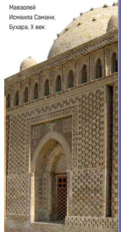
Мавзолей Исмаила Самани. Бухара. X век

Зам директора школы _____ дата _____ 20__ год