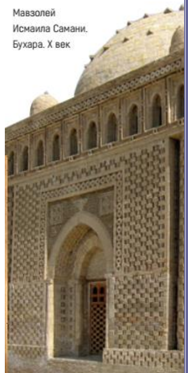
Мавзолей Исмаила Самани. Бухара. X век

Домашнее задание: На основании своих знаний по географии отметьте на карте Фергану, Исфиджаб (Сайрам), Чач, Самарканд, Бухару, Хорезм, Чаганиан, Хутталян, Кеш, Хорасан, Сеистан, Газну. Подсчитайте общую площадь этих территорий. Сравните с современной картой. Какие территории присоединил Исмаил Самани к своему государству?