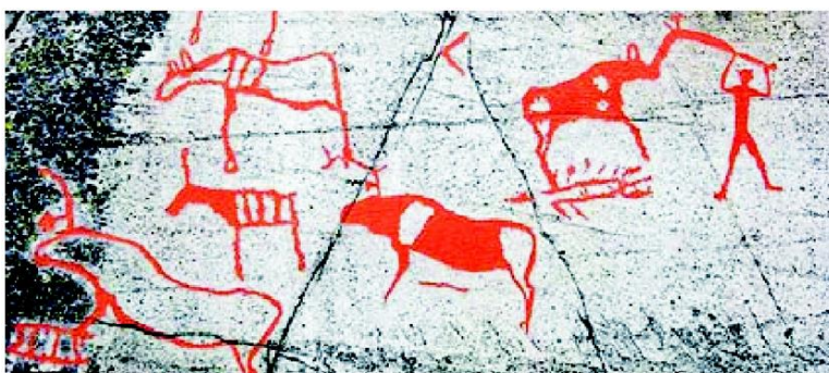
Lasko g'oridagi suratlar

8 тысячелетиях наскальные рисунки были первоначально созданы кроманьонцами. В этот период древние художники вырезали картины, в основном на скалах. Некоторые из них были найдены во всемирно известных пещерах Альтамира в Испании и Ласко во Франции, а также в