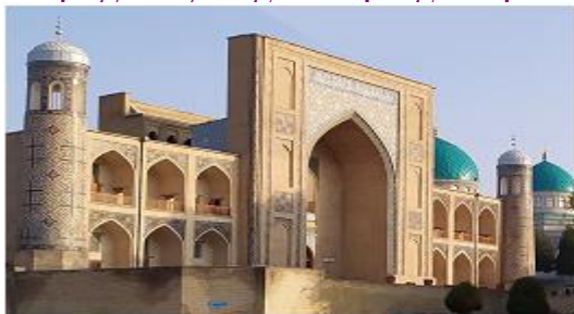
Ko'kaldosh madrasasini XVI asrda Darvishxon qurdirgan.