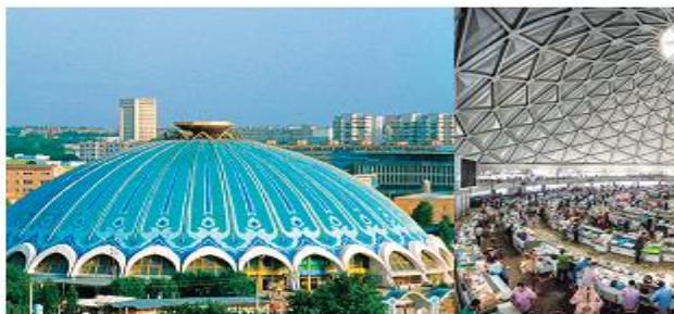
Chorsu – 1000 yillik tarixga ega bozor.