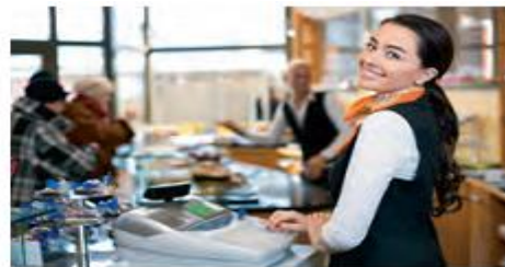
Mening opam ...

2- topshiriq.U‘qing. So‘zlang. Matn asosida o‘z matningizni tuzing.