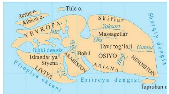
2-rasm. Miloddan avvalgi III asrda Eratosfen tuzgan dunyo xaritasi.

1. Geografik bilimlarning rivojlanishi va xaritalarning mukammallashib borishi orasida qanday bogʻliqlik bor?