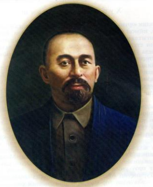
АБДУЛЛА АВЛОНИЙ (1878–1934)