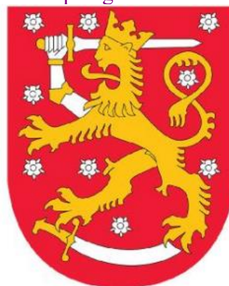
5-rasm. Finlandiyaning davlat gerbi