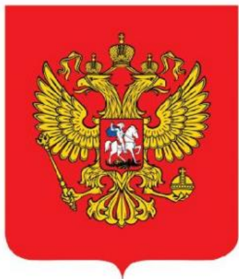
3-rasm. Rossiya Federatsiyasining davlat gerbi

Geraldikaning muhim sohalaridan biri – ramziy belgilar, emblemalar ham tasviriy san‘atning grafika turi namunalari hisoblanadi. Ayniqsa, jahonga mashhur konsernlar, avtomobil sanoati korxonalari o‘zlarining mahsulotlari uchun brend vazifasini o‘tovchi emblemalarga jiddiy e‘tibor qaratganlar