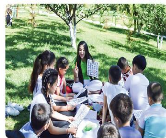
Yozgi oromgohdan lavhalar

Tasvir ishlash uchun zarur o‘quv qurollari: