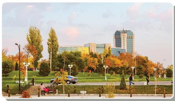
O‘zbekiston tog‘ va shaharlarida kuz manzarasi (foto)