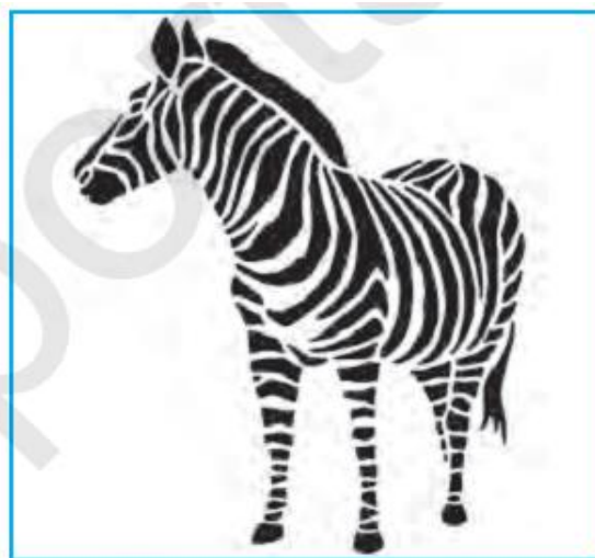
Oq va qora rang. Zebra

II. Amaliy ish: Oq va qora ranglar birikmasi qaysi san’at turiga kiradi?