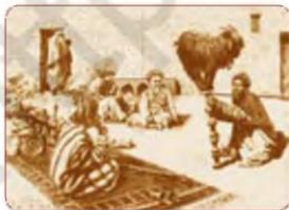
Xalq tomoshalari. XIX asr