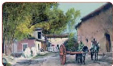
Toshkent. Eski shahar. XIX asr

1864-yil 1-oktabrida M. Chernyayev o‘zini podshoga yaxshi ko‘rsatish uchun tezlik bilan Toshkentni qo‘lga kiritmoqchi bo‘ldi. Lekin uning bu rejasi amalga oshmadi. M. Chernyayev 70 nafardan ziyod askarlaridan ajralib, Chimkentga chekinishga majbur bo‘ldi. Uning Toshkentni egallash uchun olib borgan birinchi harakati natija bermagach, yangi hujumga tayyorgarlik boshladi. Uning bu tayyorgarligi bahorgacha davom etdi va 1865-yil aprel oyi oxirida podsho hukumatining harbiy qo‘shinlari Toshkent yaqiniga joylashtirildi. M.Chernyayev boshchiligidagi harbiy qo‘shin Toshkent shahridan 25 km uzoqlikdagi Chirchiq daryosining chap sohilida joylashgan Niyozbek qal‘asiga kelib, uni jangsiz topshirishni taklif qiladi, lekin qal‘a himoyachilari rad javobini berib, mudofaaga o‘tadi.