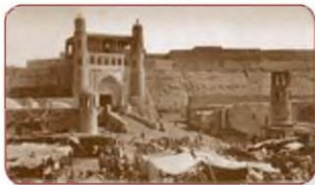
Buxoro arki. XIX asr

VI. Uyga vazifani e‘lon qilish: yangi mavzuni to‘liq takrorlash va yangi mavzu yuzasidan bilimlarini mustahkamlab kelish.