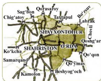
Eski shahar xaritasi. XIX asr