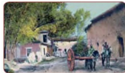
Toshkent. Eski shahar. XIX asr