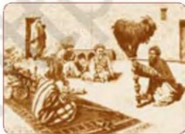
Xalq tomoshalari. XIX asr