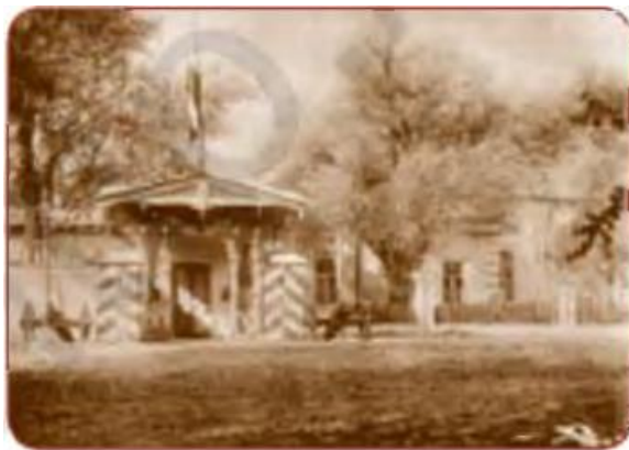
General-gubernator qarorgohi. Toshkent. XIX asr