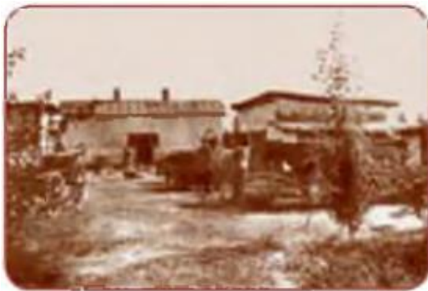
Ko‘chib kelganlar xo‘jaligi