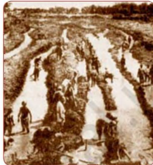
Aholi majburiyatlari. XIX asr

VI. Uyga vazifani e‘lon qilish: yangi mavzuni to‘liq takrorlash va yangi mavzu yuzasidan bilimlarini mustahkamlab kelish.