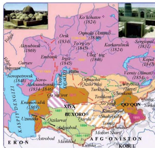
O‘rta Osiyo XIX asr oxirida