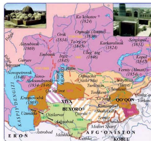
O‘rta Osiyo XIX asr oxirida