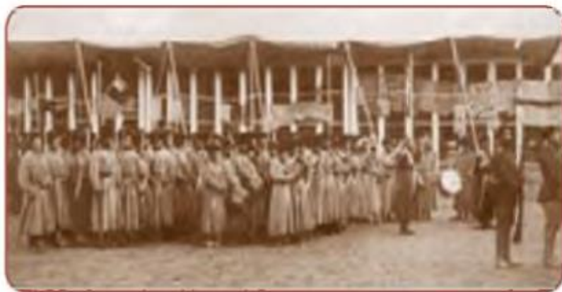
Buxoro harbiy qo‘shinlari

Toshkent shahri bosib olingandan so‘ng podsho hukumatining kelgusidagi rejasi xonliklarni navbat bilan bosib olish edi. Barcha harbiy harakatlar Toshkent shahridan turib tashkil qilindi va boshqarildi. Shu maqsadda, eng avvalo, xonliklarning birlashmasligiga qaratilgan siyosat olib borildi. Ya‘ni mustamlakachilar o‘zlarining asosiy qoidasi hisoblangan «Bo‘lib tashla, hukmronlik qil» shioriga amal qilishga kirishdi. Podsho hukumati O‘rta Osiyodan M. Chernyayevni Sankt-Peterburgga chaqirib oldi va uning o‘rniga Turkiston viloyatining gubernatori qilib F. Romanovskiyni tayinladi. F. Romanovskiy 1866-yilda Buxoro amirligi