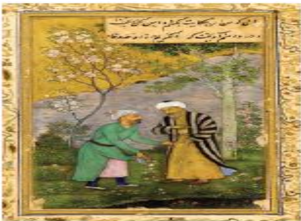
Sa‘diyning “Guliston” asariga ishlangan miniatyura

Ayol taajjubda edi. “Axir bu oddiy narsa-ku! Tushunmadim... Odamlar uzoq o‘lkalardan muammolarini hal qilish uchun kelar, Rumi esa ularga shu zahotiyoy yordam berardi...” Shunga qaramay, ayol uch haftadan so‘ng keladi. Rumi bolakayga qarab deydi: – Yana uch haftadan so‘ng keling. Shunda ayolning toqati toq bo‘lib, gap nimada ekanini so‘rashga qaror qiladi. Ammo Rumi boyagi gapini qaytaradi. Ular uchinchi marta kelishganda Rumi bolakayga deydi: – O‘g‘lim, maslahatimga quloq tut, ko‘p shirinlik yema, bu sog‘liq uchun zararli. – Menga aytyapsizmi? Boshqa yemaganim bo‘lsin, – deya javob beradi bolakay. Shundan so‘ng ona o‘g‘lidan tashqarida poylab turishini so‘raydi. Bola chiqqach, ona Rumiyan nima uchun birinchi kuniyoy shu nasihatni qilmagani haqida so‘raydi. Jaloliddin iqror bo‘lib, o‘zi ham shirinlik yeyishni yaxshi ko‘rganini, boshqalarga maslahat berishdan oldin o‘zi bu odatdan voz kechishi lozim bo‘lganini aytadi. Avvaliga buning uchun uch hafta yetarli deb hisoblaydi, ammo adashadi... Donishmandning sifatlaridan biri shu: u boshqalarni o‘zi bosib o‘tmagan yo‘ldan yurishga undamaydi. U avvalambor o‘ziga to‘g‘ri. Uning so‘zlari haqiqat bilan uyg‘un. Bu yerda bir hikmatni eslamay iloj yo‘q: “Agar rahmdil inson yolg‘on ilmni targ‘ib etsa, u haqiqatga aylanadi. Agar ahmoq odam haqiqatni aytsa, u yolg‘onga aylanadi”.