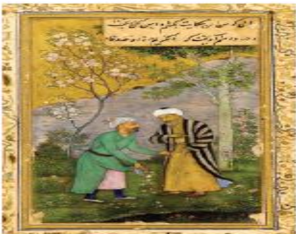
Sa‘diyning “Guliston” asariga ishlangan miniatyura

Ayol taajjubda edi. “Axir bu oddiy narsa-ku! Tushunmadim... Odamlar uzoq o‘lkalardan muammolarini hal qilish uchun kelar, Rumi esa ularga shu zahotiyoq yordam berardi...” Shunga qaramay, ayol uch haftadan so‘ng keladi. Rumi bolakayga qarab deydi: – Yana uch haftadan so‘ng keling. Shunda ayolning toqati toq bo‘lib, gap nimada ekanini so‘rashga qaror qiladi. Ammo Rumi boyagi gapini qaytaradi. Ular uchinchi marta kelishganda Rumi bolakayga deydi: – O‘g‘lim, maslahatimga quloq tut, ko‘p shirinlik yema, bu sog‘liq uchun zararli. – Menga aytyapsizmi? Boshqa yemaganim bo‘lsin, – deya javob beradi bolakay. Shundan so‘ng ona o‘g‘lidan tashqarida poylab turishini so‘raydi. Bola chiqqach, ona Rumiyan nima uchun birinchi kuniyoq shu nasihatni qilmagani haqida so‘raydi. Jaloliddin iqror bo‘lib, o‘zi ham shirinlik yeyishni yaxshi ko‘rganini, boshqalarga maslahat berishdan oldin o‘zi bu odatdan voz kechishi lozim bo‘lganini aytadi. Avvaliga buning uchun uch hafta yetarli deb hisoblaydi, ammo adashadi... Donishmandning sifatlaridan biri shu: u boshqalarni o‘zi bosib o‘tmagan yo‘ldan yurishga undamaydi. U avvalambor o‘ziga to‘g‘ri. Uning so‘zlari haqiqat bilan uyg‘un. Bu yerda bir hikmatni eslamay iloj yo‘q: “Agar rahmdil inson yolg‘on ilmni targ‘ib etsa, u haqiqatga aylanadi. Agar ahmoq odam haqiqatni aytsa, u yolg‘onga aylanadi”.