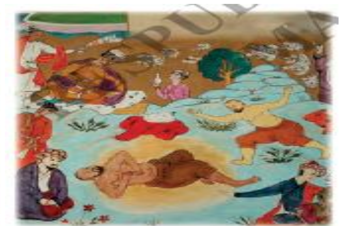
Pahlavon Mahmudning hind polvani bilan kurash tushishi. Noma‘lum musavvir

IV. Yangi mavzuni mustahkamlash: Jaloliddin Rumiyning tasavvufiy hikoyatlarida qanday g‘oyalar mavjud?