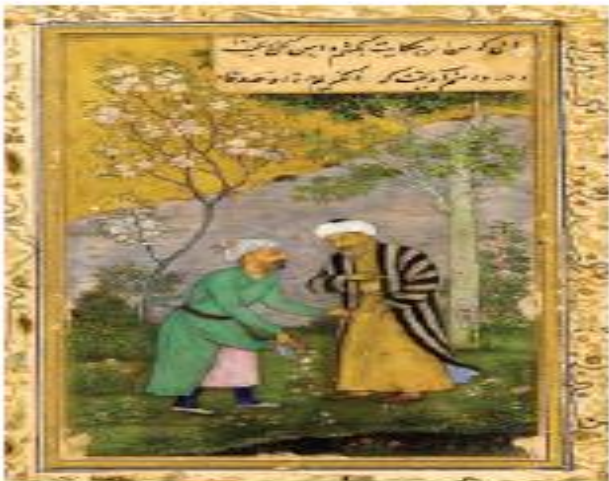
Sa‘diyning “Guliston” asariga ishlangan miniatyura

Ayol taajjubda edi. “Axir bu oddiy narsa-ku! Tushunmadim... Odamlar uzoq o‘lkalardan muammolarini hal qilish uchun kelar, Rumi esa ularga shu zahotiyoq yordam berardi...” Shunga qaramay, ayol uch haftadan so‘ng keladi. Rumi bolakayga qarab deydi: – Yana uch haftadan so‘ng keling. Shunda ayolning toqati toq bo‘lib, gap nimada ekanini so‘rashga qaror qiladi. Ammo Rumi boyagi gapini qaytaradi. Ular uchinchi marta kelishganda Rumi bolakayga deydi: – O‘g‘lim, maslahatimga quloq tut, ko‘p shirinlik yema, bu sog‘liq uchun zararli. – Menga aytyapsizmi? Boshqa yemaganim bo‘lsin, – deya javob beradi bolakay. Shundan so‘ng ona o‘g‘lidan tashqarida poylab turishini so‘raydi. Bola chiqqach, ona Rumiyan nima uchun birinchi kuniyoq shu nasihatni qilmagani haqida so‘raydi. Jaloliddin iqrar bo‘lib, o‘zi ham shirinlik yeyishni yaxshi ko‘rganini, boshqalarga maslahat berishdan oldin o‘zi bu odatdan voz kechishi lozim bo‘lganini aytadi. Avvaliga buning uchun uch hafta yetarli deb hisoblaydi, ammo adashadi... Donishmandning sifatlaridan biri shu: u boshqalarni o‘zi bosib o‘tmagan yo‘ldan yurishga undamaydi. U avvalambor o‘ziga to‘g‘ri. Uning so‘zlari haqiqat bilan uyg‘un. Bu yerda bir hikmatni eslamay iloj yo‘q: “Agar rahmdil inson yolg‘on ilmni targ‘ib etsa, u haqiqatga aylanadi. Agar ahmoq odam haqiqatni aytsa, u yolg‘onga aylanadi”.