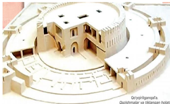
Qo‘yqirilgan qal‘a. Qazishmalar va tiklangan holati

Ahamoniylar davlatidan ajralib chiqib, mustaqil davlatga aylandi. Makedoniyalik Aleksandr hukmronligi davrida ham Xorazm davlati mustaqil edi. Qadimgi yunon tarixchisi Arrianning yozishicha, bu davrda Xorazmda Farasmanpodsholik qilgan. Mil. avv. IV–III asrlarda Xorazm O‘rta Osiyoda shaharsozlik va me‘morchilik keng rivojlangan muhim markaz ga aylanadi. Davlat chegaralarida hamda savdo yo‘llari bo‘ylab qal‘alar quriladi. Xorazmning Xiva, Jonbosqal‘a,