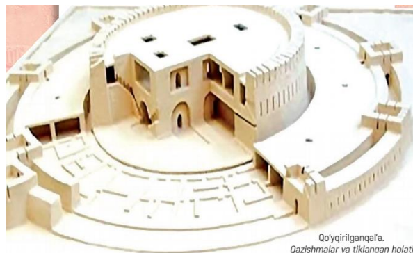
Qo‘yqirilganqal‘a. Qazishmalar va tiklangan holati

Ahamoniylar davlatidan ajralib chiqib, mustaqil davlatga aylandi. Makedoniyalik Aleksandr hukmronligi davrida ham Xorazm davlati mustaqil edi. Qadimgi yunon tarixchisi Arrianning yozishicha, bu davrda Xorazmda Farasmanpodsholik qilgan. Mil. avv. IV–III asrlarda Xorazm O‘rta Osiyoda shaharsozlik va me‘morchilik keng rivojlangan muhim markaz ga aylanadi. Davlat chegaralarida hamda savdo yo‘llari bo‘ylab qal‘alar quriladi. Xorazmning Xiva, Jonbosqal‘a,