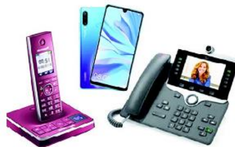
Zamonaviy telefon apparatlari

Telefonning yaratilishi va uning kishilar hayotida tutgan o‘rni haqida so‘zlab bering.