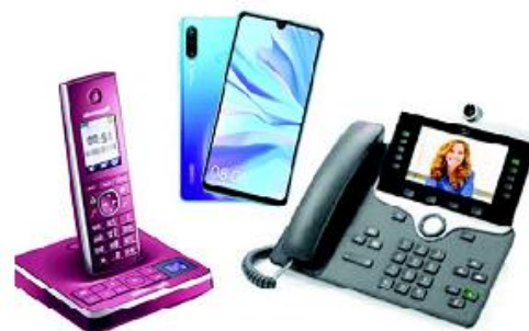
Zamonaviy telefon apparatlari

Telefonning yaratilishi va uning kishilar hayotida tutgan o‘rni haqida so‘zlab bering.