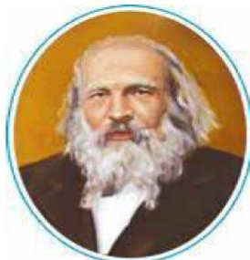
Dmitriy Mendeleev (1834–1907)