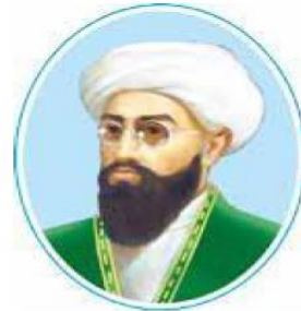
Mahmudxo‘ja Behbudiy (1875–1919)