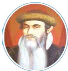
Iogann Gutenberg (1400–1468)

Xalqimiz hayotda yaxshi nom qoldirgan odamni bog‘bonga o‘xshatadi. Yaxshi insonni yana nimalarga qiyoslash mumkin?