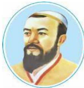
Ajiniyoz Qosiboy o‘g‘li (1824–1878)