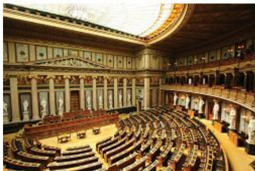
Парламентский зал в Австрии