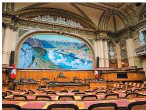
Парламентский зал в Швейцарии

Знаете ли вы, сколько стран в мире являются федерациями? Их довольно много: 6 находятся в Европе, 6 — в Азии, 6 — в Африке, 7 — в Америке. Федерациями также являются Австралия и Коморские острова. В Европе, например, это Австрия. Она имеет официальное название Австрийская Республика. Её федеративное устройство закреплено в конституции, принятой в 1920 году. Австрия состоит из самостоятельных субъектов, которые называются землями. Каждая земля имеет свою конституцию и гражданство, но не имеет своего языка. Главой государства является президент. Федеративная Республика Германия является парламентской республикой и состоит из 16 земель, каждая из которых имеет свою конституцию. В стране есть и основная конституция, которая действует с 23 мая 1949 года. Одной из самых старых стран с федеративным устройством является Швейцария. Она состоит из 26 субъектов, на территории которых имеются свои конституции и языки. Как