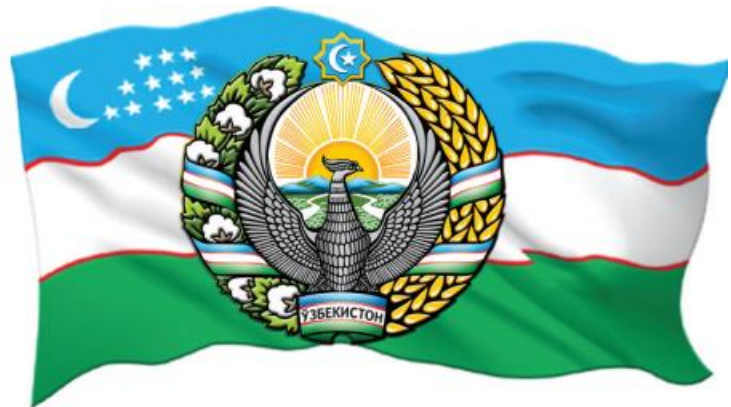
Символы государства: герб и флаг