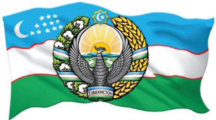
Символы государства: герб и флаг