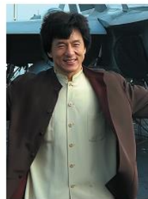
Это Джеки Чан...