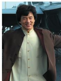
Это Джеки Чан...