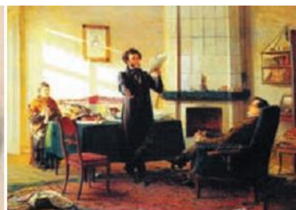
А. Лактионов. «Вновь я посетил...» П. Соколов. Портрет А. Пушкина