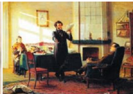
А. Лактионов. «Вновь я посетил...»