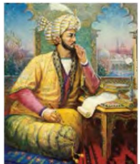
Zahiriddin Muhammad Bobur

VI. Uyga vazifani e‘lon qilish: yangi mavzuni to‘liq takrorlash va yangi mavzu yuzasidan bilimlarini mustahkamlab kelish.