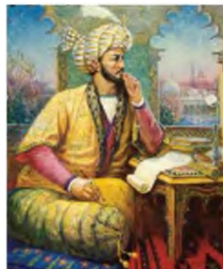
Zahiriddin Muhammad Bobur

VI. Uyga vazifani e‘lon qilish: yangi mavzuni to‘liq takrorlash va yangi mavzu yuzasidan bilimlarini mustahkamlab kelish.