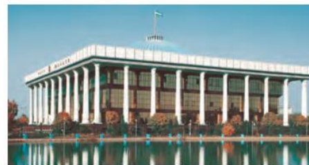
O‘zbekiston Respublikasi Oliy Majlisining binosi

VI. Uyga vazifani e‘lon qilish: yangi mavzuni to‘liq takrorlash va yangi mavzu yuzasidan bilimlarini mustahkamlab kelish.