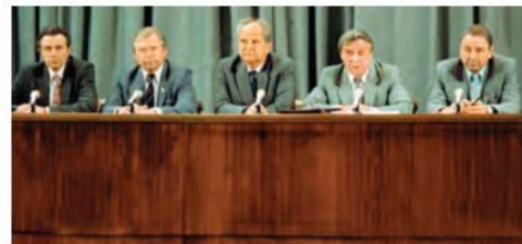
Favqulodda holat davlat komiteti a‘zolari

VI. Uyga vazifani e‘lon qilish: yangi mavzuni to‘liq takrorlash va yangi mavzu yuzasidan bilimlarini mustahkamlab kelish.