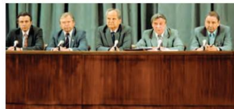
Favqulodda holat davlat komiteti a‘zolari

VI. Uyga vazifani e‘lon qilish: yangi mavzuni to‘liq takrorlash va yangi mavzu yuzasidan bilimlarini mustahkamlab kelish.