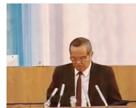
I. Karimov O‘zbekiston Respublikasining davlat mustaqilligini e‘lon qilmoqda.

VI. Uyga vazifani e‘lon qilish: yangi mavzuni to‘liq takrorlash va yangi mavzu yuzasidan bilimlarini mustahkamlab kelish.