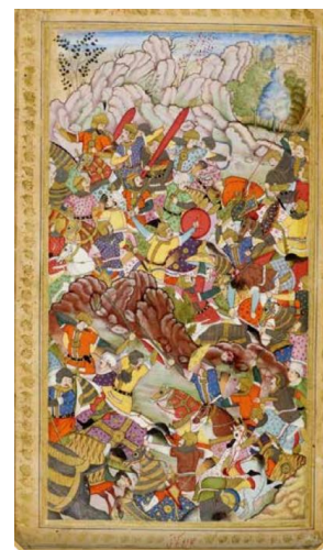
“Boburnoma”ga ishlangan miniatyura

VI. Uyga vazifani e‘lon qilish: yangi mavzuni to‘liq takrorlash va yangi mavzu yuzasidan bilimlarini mustahkamlab kelish.