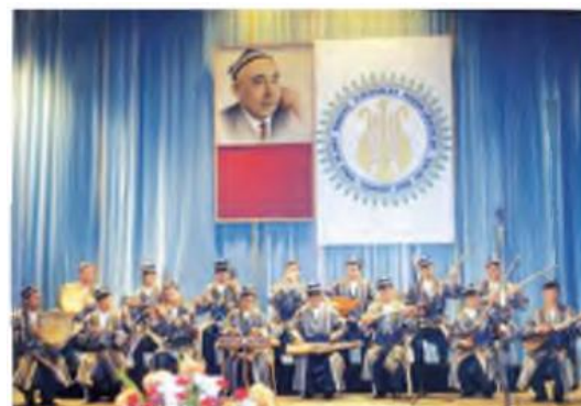
Zamonaviy cholg‘uchilar ansambli

VI. Uyga vazifani e‘lon qilish: yangi mavzuni to‘liq takrorlash va yangi mavzu yuzasidan bilimlarini mustahkamlab kelish.