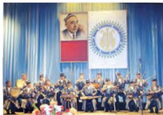
Zamonaviy cholg‘uchilar ansambli

VI. Uyga vazifani e‘lon qilish: yangi mavzuni to‘liq takrorlash va yangi mavzu yuzasidan bilimlarini mustahkamlab kelish.