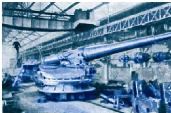
Shnayder zavodida to‘plarni yig‘ish jarayoni.

Fraziya Prasiya urushi davom etayotgan rihning tugailanishi 1871-yilmng 18-yanvanda barcha german davlatlarining monarxlarlari Versalda to‘planib, Prussiya qiroli Vilgelm I ni Germaniya imperatori deb e‘lon qildilar. Bu Germaniyaning ikkinchi marta imperiya deb e‘lon qilinishi edi. (Eslang: Germaniya qachon birinchi marta imperiya deb e‘lon qilingan edi?) Shunday qilib, butun Germaniya hududining 2/3 qismida joylashgan, aholisining esa 60%i yashayotgan Prussiya monarxiyasi yetakchiligida Germaniyaning birlashuvi tugallandi. Yagona va yaxlit Germaniya imperiyasi barpo etildi. Konstitutsiyaga muvofiq, imperiyaning oliy vakolatli muassasalari Ittifoq Kengashi (Bundesrat) bilan Reyxstag edi. Konstitutsiyada bir-lashgan Germaniyada Prussiya gegemonligi mustahkamlab qo‘yildi. Imperator urush sulh tuzar, xalqaro munosabatlarda imperiya nomidan ish ko‘rardi. Ayni paytda, u imperiya qurolli kuchlarining bosh qo‘mondoni ham edi. Imperator o‘z ixtiyori bilan Reyxstag va Ittifoq Kengashi sessiyalarini chaqirish, ochish, tarqatib yuborish yoki muddatini cho‘zish, imperiya kanslerini tayinlash va ozod etish huquqlariga ega edi.