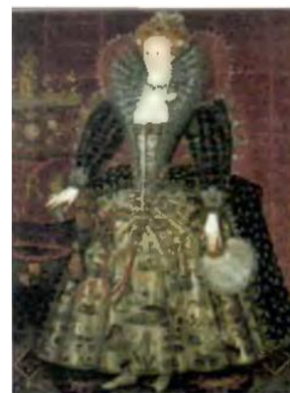
Yelizaveta I – Angliya qirolchasi

VI. Uyga vazifani e‘lon qilish: yangi mavzuni to‘liq takrorlash va yangi mavzu yuzasidan bilimlarini mustahkamlab kelish.