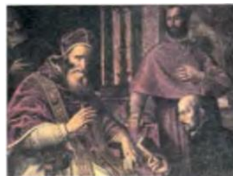
Ignatiy Loyola Rim papasi huzurida

VI. Uyga vazifani e‘lon qilish: yangi mavzuni to‘liq takrorlash va yangi mavzu yuzasidan bilimlarini mustaxkamlab kelish.