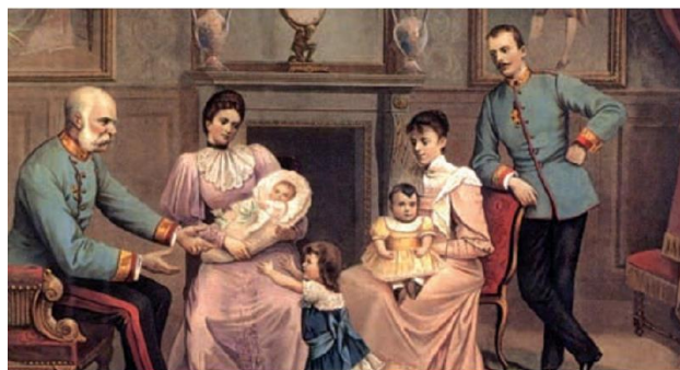
Avstriya-Vengriya imperatori Frans Iosif I va uning oilasi

III. Yangi mavzu bayoni: XIX asr oxirida Sharqiy Yevropaga Bolqon mamlakatlari, shuningdek, Avstriya-Vengriya va Rossiya imperiyalarining bir qismi kirardi. XIV–XV asrlarda Bolqon mamlakatlarida o‘rnatilgan Usmoniy imperiyasi hukmronligi XIX asrgacha, ba’zi hududlarda XX asrgacha saqlanib qoldi. 1878-yili Rossiya yordamiga tayangan Serbiya o‘z mustaqilligini e’lon qildi. Shundan so‘ng Serbiya jadal rivojlandi va Rossiyaga yanada yaqinlashib bordi. Ammo aholisi serblardan iborat va Serbiya bilan birlashish azaliy orzusi bo‘lgan ikkita yirik viloyatlar – Bosniyava Gersegovina 1908-yili Avstriya tomonidan anneksiya qilindi. Avstriya-Vengriya imperiyasi 1867-yili ikki davlat – Avstriya va Vengriya hukmron doiralarning kelishuvi asosida tashkil topgan edi. Ungacha Chexiya, Moraviya, Galitsiyava Bukovina Avstriya tarkibiga, Slovakiya, Xorvatiyava Transilvaniya