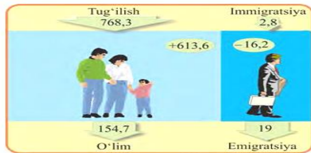
8-rasm. Aholining tabiiy va mexanik ko‘payishi (2018-yil, ming kishi hisobida).