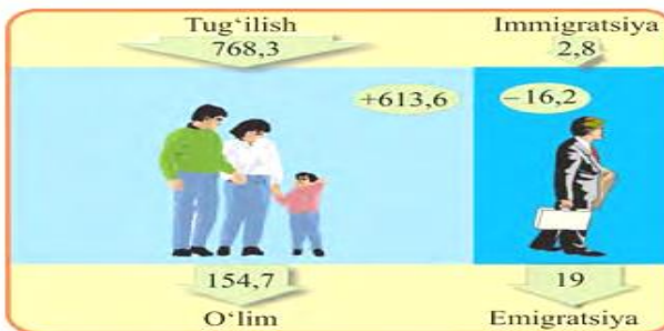
8-rasm. Aholining tabiiy va mexanik ko‘payishi (2018-yil, ming kishi hisobida).