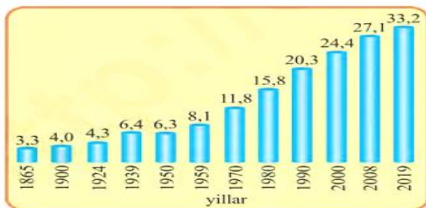
7-rasm. O‘zbekiston aholisining ko‘payishi (mln kishi hisobida).

O‘zbekiston kelajakda buyuk davlat bo‘lishi uchun qulay tabiiy sharoit ham, xilma-xil tabiiy boyliklar ham yetarlidir. Ammo bu boyliklar odamlarningaqiliy va jismoniy mehnati orqaligina kishilar ehtiyojiga, jamiyat ravnaqiga xizmat qilishi mumkin. Millionlar mehnatini oqilona tashkil etish uchun aholi soni, tarkibi va mamlakat bo‘ylab joylashishi hisobga olinishi lozim.