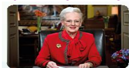
Daniya qirolichi Margrete II

Jahon mamlakatlarining muhim belgilaridan biri boshqaruv shakli hisoblanadi. Siyosiy boshqaruvning ikki asosiy shakli — respublika va monarxiyaga ajratiladi. Jahonning siyosiy xaritasida 2022-yil boshi holatiga ko‘ra, boshqaruv shakli respublika bo‘lgan 151 ta davlat mavjud. Respublikalar asosan 3 ta turga bo‘linadi: prezidentlik, parlamentar hamda aralash.