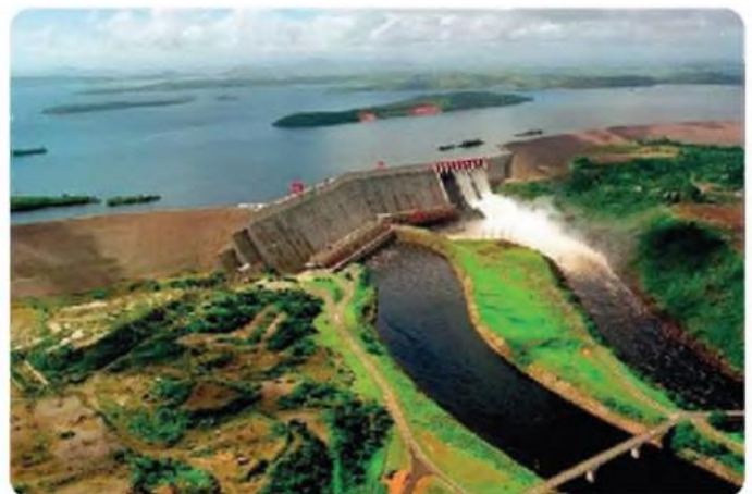
7-rasm. Dunyodagi eng yirik suv omborlaridan biri — Karuna daryosidagi Guri suv ombori (Venesuela)

1. O‘tilgan mavzu yuzasidan savol-javob qilish.