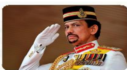
Bruney sultoni Hassanal Bolqiya