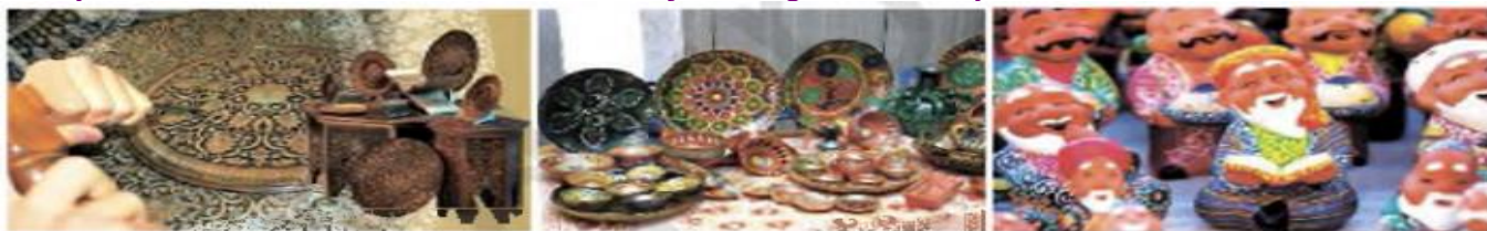
1-rasm. Xalq hunarmandlari ishlaridan namunalalar.

Asrlar davomida orttirilgan va madaniy boyligimiz, xususan, sho‘ro tuzumi davrida o‘zbek milliy xalq amaliy bezak san‘atining eng ko‘p rivojlangan turlaridan ganchkorlik, naqqoshlik, yog‘och o‘ymakorligi, toshtaroshlik, suyak o‘ymakorligi, kandakorlik, pichoqchilik, zargarlik, kashtachilik, zardo‘zlik, gilamchilik kabi turlarning o‘ziga xos tomonlari, bajarish texnologiyasi, haqiqiy asl nomlari, o‘ziga xos maktablari, uslublarini yaratgan ustalarning nomlari asta-sekin yo‘qolib ketish xavfi ostida qoldi. Bugungi kunda mustaqil mamlakatimizda xalqimizning asrlar bo‘yi yaratgan mehnati natijasida yaratilgan amaliy bezak san‘atini ko‘z qorachig‘idek saqlash, qadrlash, ulardan amaliy foydalanish, yoshlarga o‘rgatish orqali ularning estetik didini o‘stirish hamda yuksak madaniyatli kishilar qilib tarbiyalash uchun keng imkoniyatlar ochildi. Abu Rayhon Beruniy, Abu Ali Ibn Sino, Al-Xorazmiy, Nizomiy Ganjaviy, Nosir Xisrav, Alisher Navoiy, Kamoliddin Behzod, Bobur kabi jahonga mashhur olim, shoir va musavviralar xalqimizni go‘zallikka intilishga chaqirgan. Bobomiz Amir Temur hunar va ilm egalari, yirik mutaxassis olimlar yordamiga tayanib matematika, geometriya, me‘morchilik, astronomiya, adabiyot, tilshunoslik, tarix, musiqa, tasviriy san‘at va hattotlik kabi san‘at asarlarini rivojlantirishga katta ahamiyat berdi.